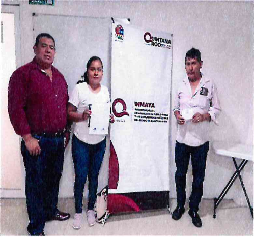
Entrega de vales de alimentación, a delegados de la comunidad El Cedral, municipio de Othón P. Blanco.