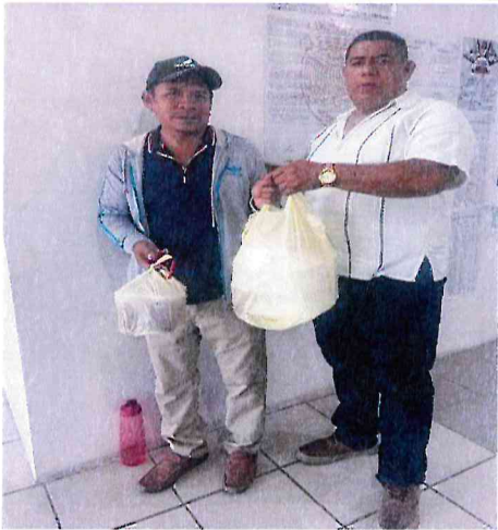
Entrega de vales de alimentación. Comunidad de Felipe Carrillo Puerto.