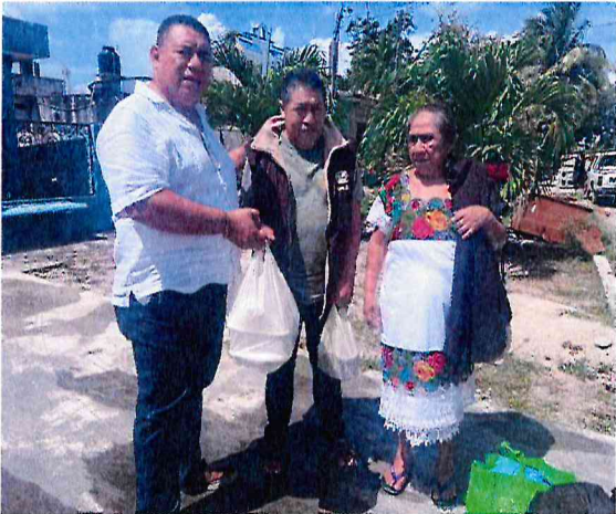
Entrega de vales de alimentación. Comunidad de X Cabil, municipio de José María Morelos.