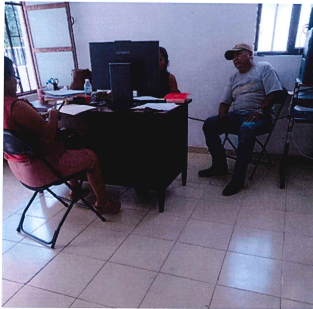
Foto 1. asesorías a representantes de un grupo de cinco integrantes provenientes de la comunidad maya de Santa Rosa