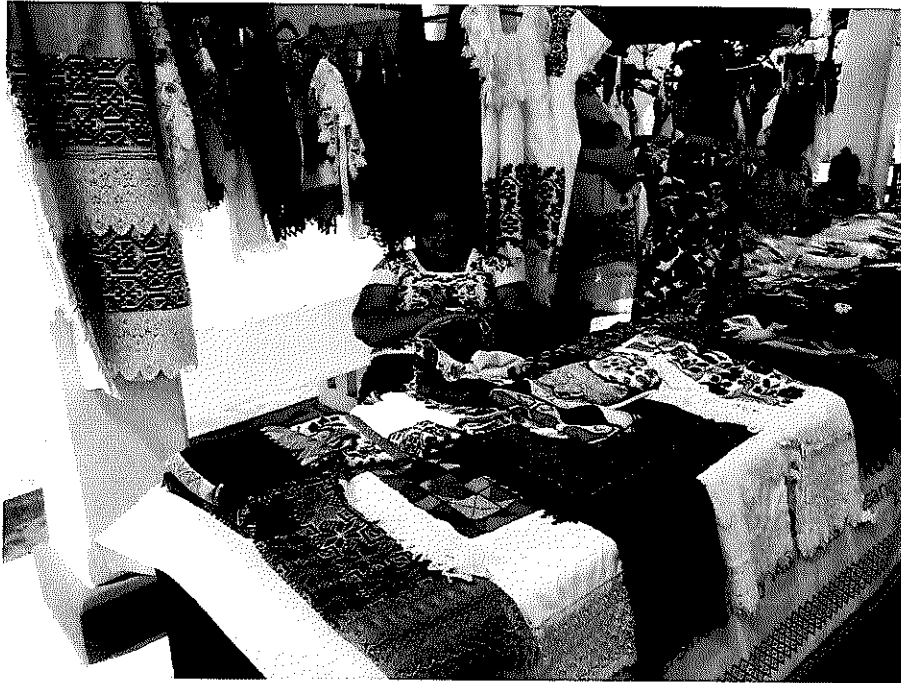
Foto 1 Exposición de artesanías textiles.