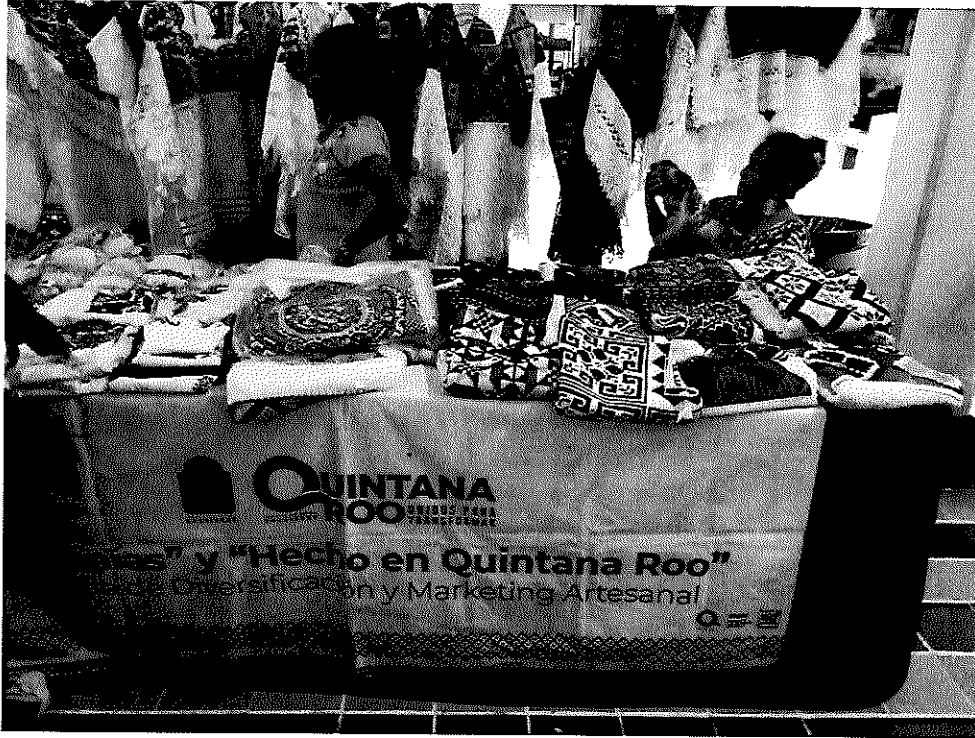
Foto 3 Exposición de artesanías textiles.