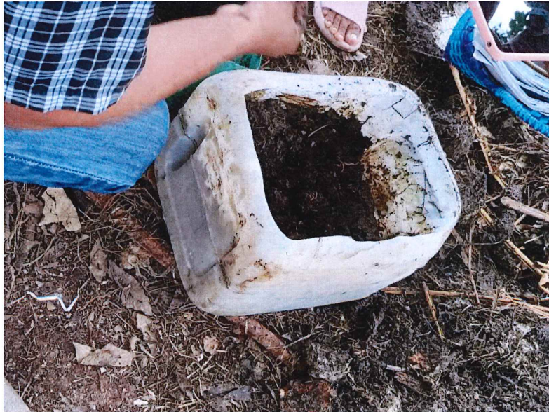
Foto 2. Núcleo de Lombriz Roja Californiana.