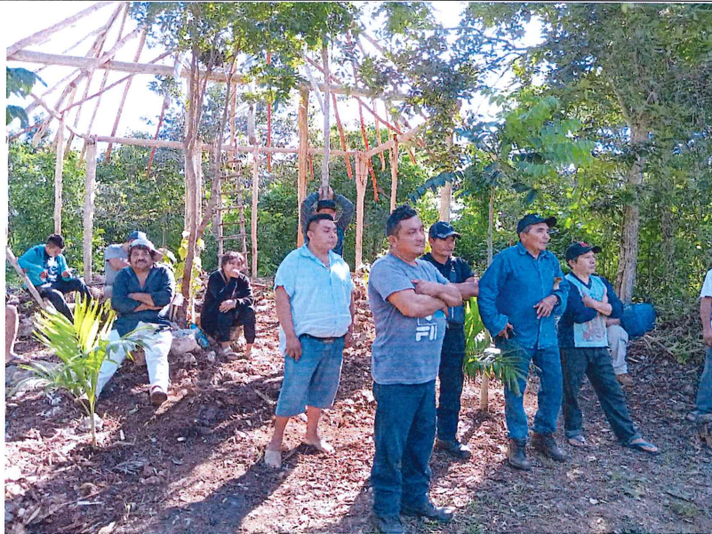
Foto 1. Productores de Maíces Nativos.