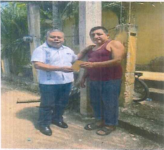
Centro Ceremonial. Tixcocal Guardia