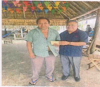
Centro Ceremonial. Chan Cah Veracruz