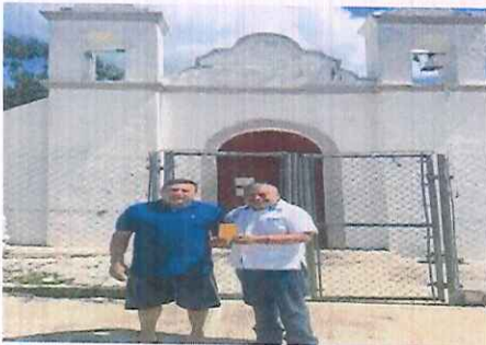
Iglesia Maya Yax Ley